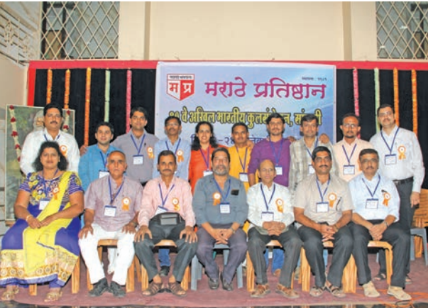
युवा टीम, अनुभवी कार्यकारिणी सदस्यांसमवेत